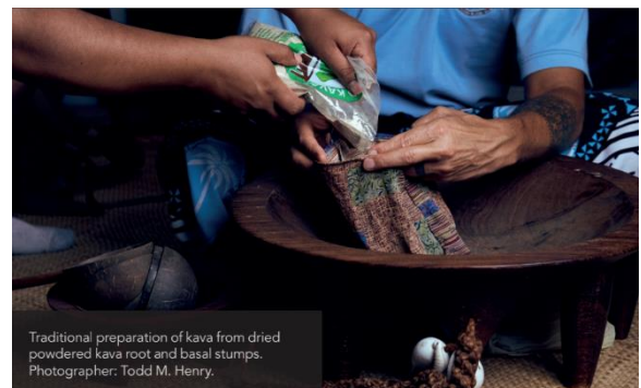
Traditional preparation of kava from dried powdered kava root and basal stumps.

O nisi o su'esu'ega ua tuana'i sa fa'atino e Dr Aporosa, sa ia fa'aalia manino ai nei fa'afitauli. Ma e taua tele lea ona ua fa'atupulaia tele le fuainumera o tagata e auai i inuga ava. E aofia ai tagata Pasefika o lo'o aumau ma nonofo i atunu'u ese, aemaise foi o nisi o i latou o ni tagata nu'u mai isi atunu'u e le o ni Pasefika.