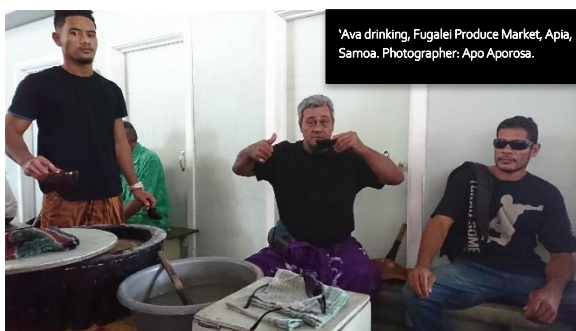
'Ava drinking, Fugalei Produce Market, Apia, Samoa.

O saili'iliga lata mai na fa'ataunu'uina e le ali'i su'esu'e ia Dr Aporosa, ua fa'amautuina ai e fa'apea, o le ava, e i ai ona a'afiaga peitai e ese'ese pe a faatusatusa i le ava malosi (pia) ma isi fuala'au malolosi fa'asaina. Na ia fa'amatalaina e fa'apea; 'Ona talu ai la ua fa'amautu i su'esu'ega o le ava, e tele sona a'afiaga tuga i le vaega ua taua o le 'Fa'atulaga le Fa'amasinoina o le Taimi' ( Temporal Order Judgement ), ae e le tutusa lava lona fa'atusaina o a'afiaga e maua ai le fa'ai ma le mafaufau o i latou e tagofia ma fa'aaogaina le ava malosi (pia) ma fuala'au malolosi fa'asaina. Ua fa'aalia foi i nei su'esu'ega e fa'apea, o a'afiaga o le ava i le tagata, e le tatau ma e le talafeagai foi ona fa'amatalaina pe fa'aigoaina foi o se vai/vaila'au/vai inu, e i ai ni ona a'afiaga leaga e pei ona i ai i vaila'au ma fuala'au malolosi fa'asaina, ma fuala'au e fa'atupu ai le valea (amioga le taupulea). Sa ia fa'apea mai foi, 'O se mataupu masani ua tele ina fa'aaogaina e tagata e fa'amatala ai a'afiaga o le ava, ua fa'aigoaina fa'apea o le ( kava intoxication ) po'o le ona/fa'asuaava i le ava. O nei mau ma manatu ua le fa'avaea ma e le sa'o foi.'